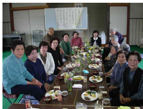
ふれあいいきいきサロン

ボランティアと子どもたちの交流を通じ、次代を担う子供たちの成長を促すことを目的に開催。