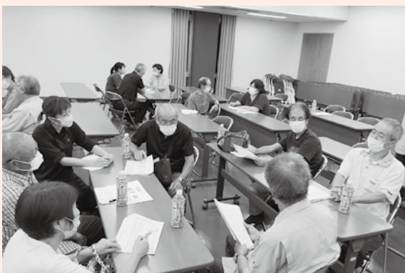
← 地区別懇談会の様子②

住み慣れた地域で安心して暮らしていくためには、日頃のちょっとした声かけやお互いを気にかけることが大切です。美祢市社協は、今後とも、そのつながりづくりを推進していきますので、ご協力をお願いします。