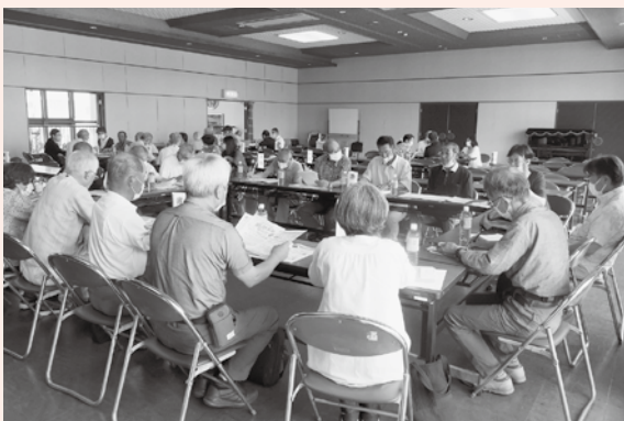
← 地区別懇談会の様子①