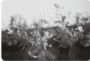
みんなで生け花をしました！

地 区：岡の台(美東町) 開催場所：岡の台集会所 結成時期：平成30年4月 会 員 数：11名