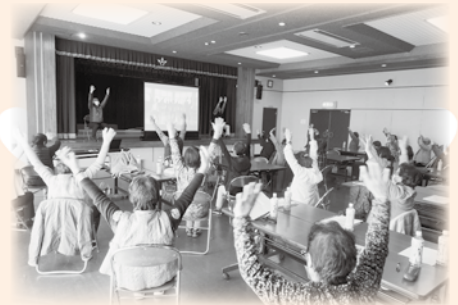
↑ よいせさこい体操