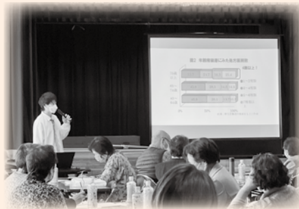
↑ 薬剤師さんのお話