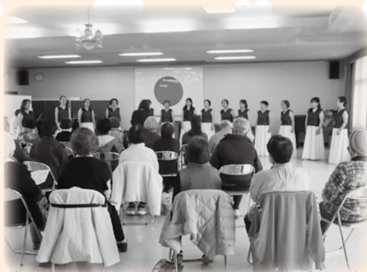
↑ 「Feminine Chor さくら」様による演奏