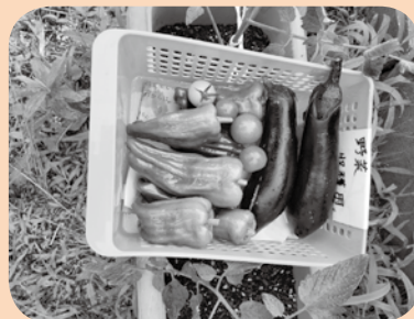
※写真は、昨年収穫したものです。