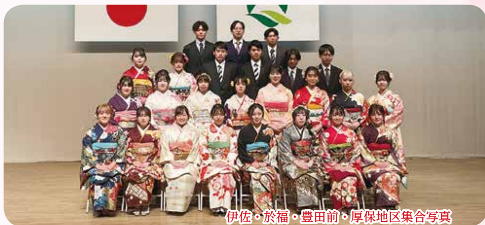
伊佐・於福・豊田前・厚保地区集合写真