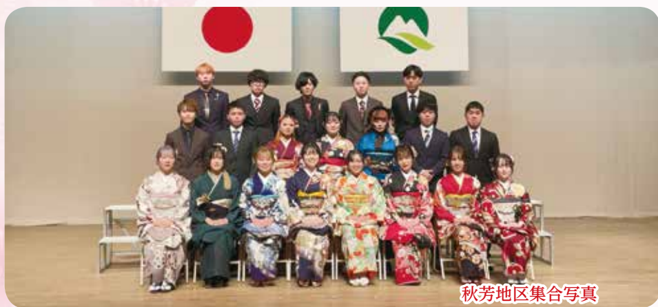
秋芳地区集合写真