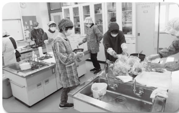
サロンで調理中の様子

月に1回集まり、季節に合わせた料理を作って地域の方々にお配りしております。新しい仲間も募集中ですので、興味のある方は是非お越しください！