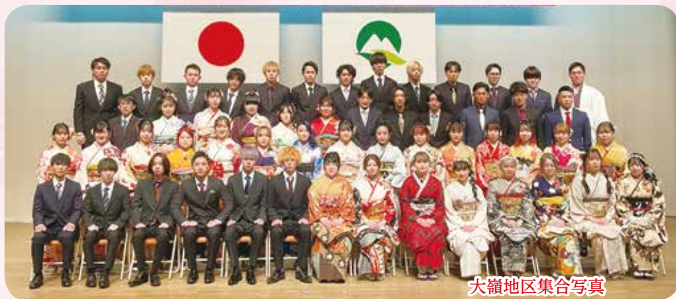
大嶺地区集合写真