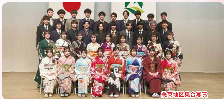
美東地区集合写真

←こちらのQRコード でお申し込みができ ます。お名前(ふりが な)・性別・生年月・ 一言・町名・電話番 号・記入の上、ご応 募願います。