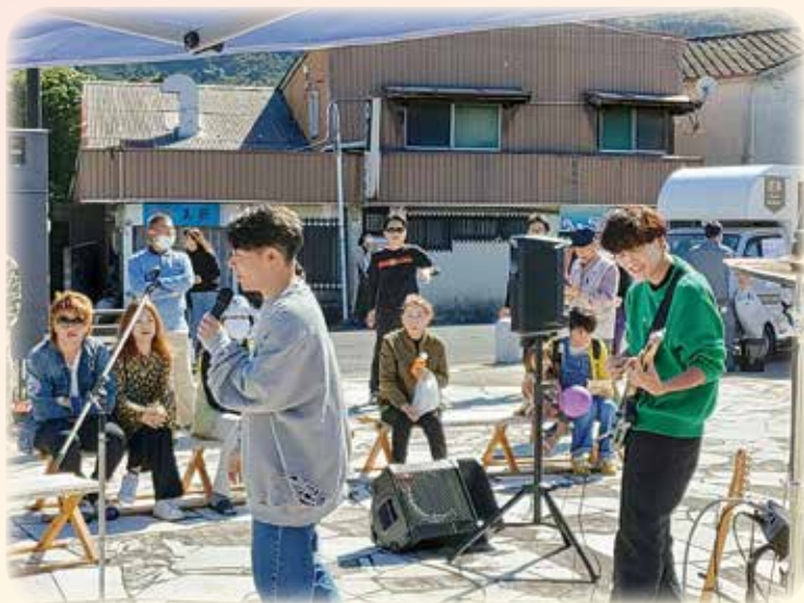
バンド演奏 美祢会場