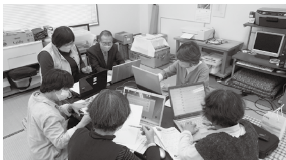
ボランティア活動の様子

新聞やはがき随筆の点訳、触読技術の指導などニーズに応じた幅広い活動も精力的に行っています。点字に興味がある、自分も学んでみたいという方がいらっしゃいましたら、美祢市社協までお問い合わせください。