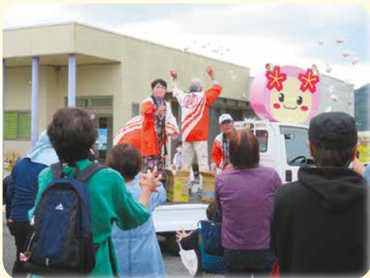
もちまき 秋芳会場

今年も美祢・美東・秋芳の各地域において、福祉の市メモリアルイベントを行いました！それぞれが地域の特色を生かした内容で開催しました。次ページから、各会場の様子をご紹介しますので、ぜひご覧ください。