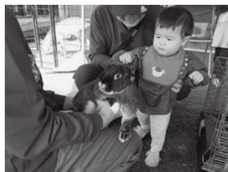
👉 どうぶつふれあい