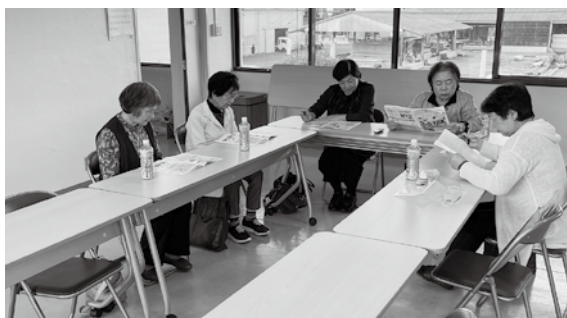
ボランティア活動の様子

現在、音訳版の市報や社協だよりの新しいお届け先を大募集中です！ご興味のある方は美祢市社協までお問い合わせをお待ちしております。また、音訳データは美祢市社協ホームページでも公開していますので、ぜひ試聴してみてください。