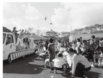
👉 もちまき&菓子まき