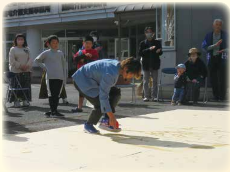
ウォーターアートパフォーマンス 美東会場