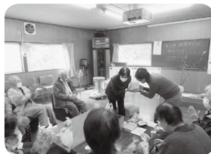
▲ 1位には素敵な賞品が♪