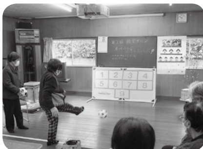
▲ 狙いをさだめてキック！