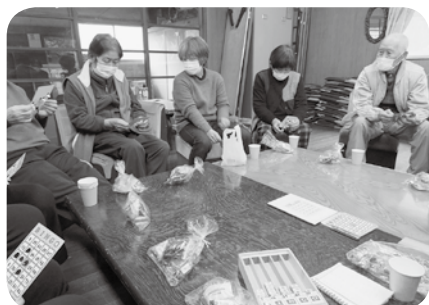
▲ 白熱のビンゴ大会でした

サッカーボールの的あてゲームやビンゴを皆で和気あいあいと楽しんでおられました。その後お茶やお菓子を食べながら昔懐かしい話に花が咲き、大いに盛り上がりおられました。