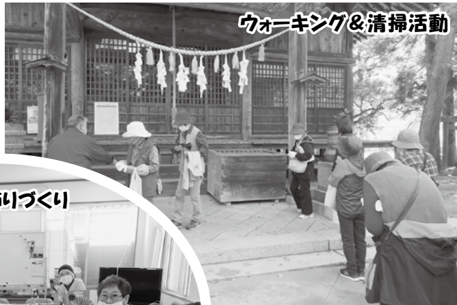
羽子板飾りづくり