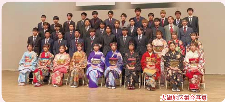
大嶺地区集合写真