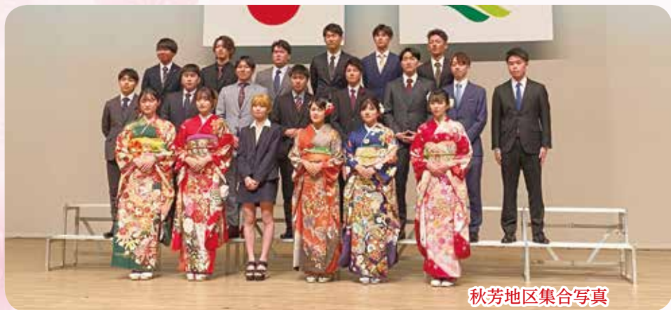
秋芳地区集合写真