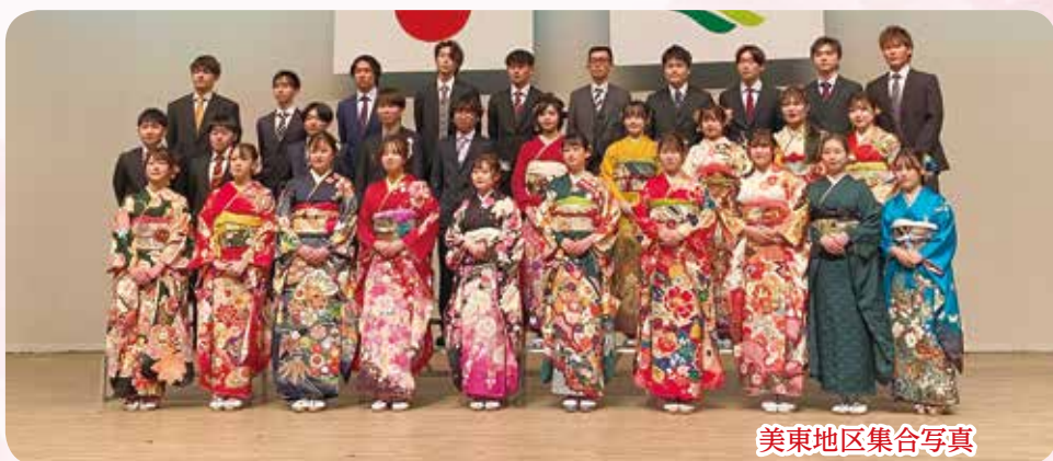
美東地区集合写真

←こちらのQRコード でお申し込みができ ます。お名前(ふり がな)・性別・生年月 ・一言・町名・電話番 号・記入の上、ご応 募願います。