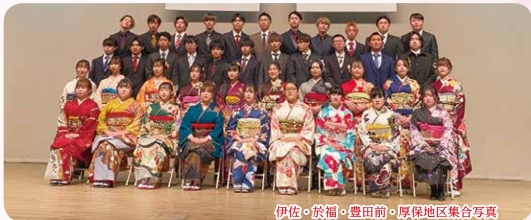
伊佐・於福・豊田前・厚保地区集合写真