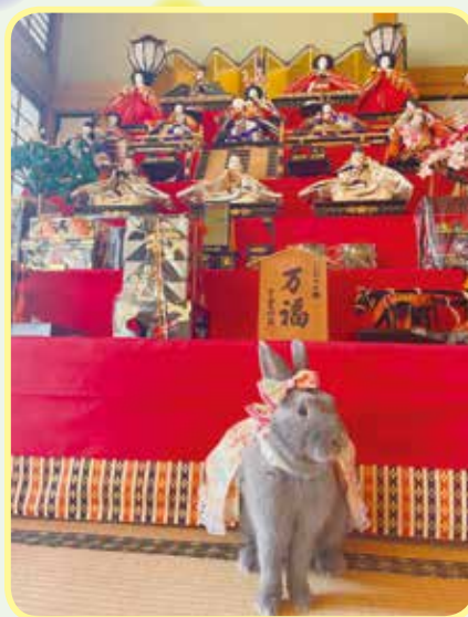
むらた 村田家のおはつちゃん 令和2年8月生 秋芳町 バナナとリンゴが大好き♡