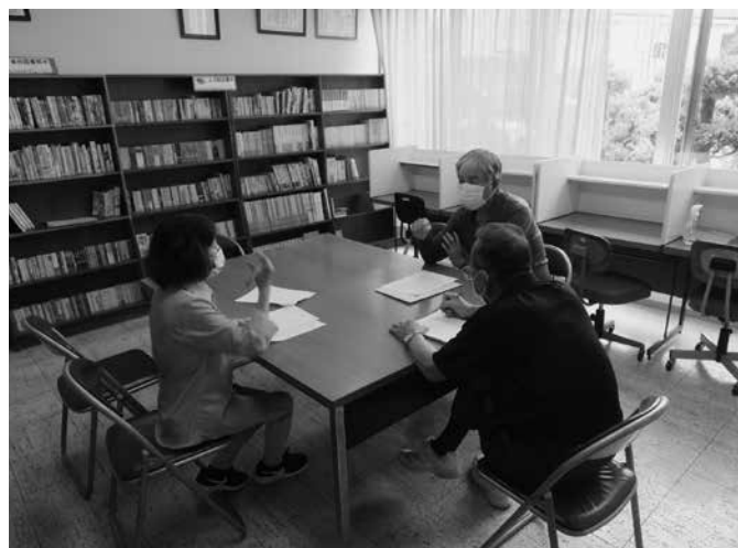
小地区に分かれて懇談会の様子