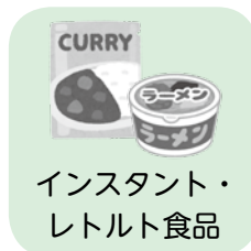
インスタント・レトルト食品