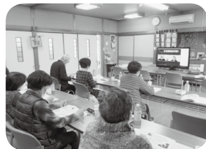
リモート参加(美東)の様子

参加者からは、「コロナ禍でもつながる大切さを感じた」「オンラインでの研修会は初めてだったが、感染の不安もなく、意外とよくつながって感心した」などの声もありました。