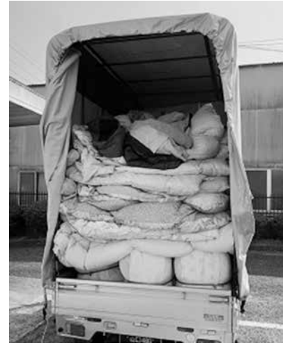
皆様からお寄せいただいた羽毛製品

引き続き不要になった羽毛製品の寄付を受け付けております。地域福祉活動の発展のために、ご協力よろしくお願いします。