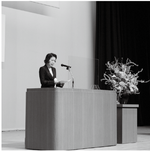
主催者あいさつ（美祢市社協会長）

表彰式では、永年にわたり、美祢市の地域福祉向上、支援活動に貢献され功績が顕著な方への表彰を行いました。今大会にて、表彰を受けられた皆さまを次ページにてご紹介いたします。