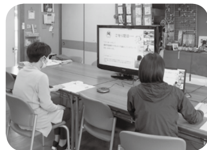
さをり姫の発表の様子