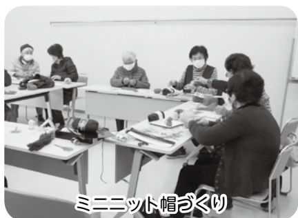
ミニニット帽づくり