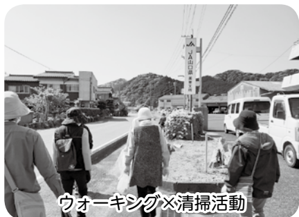
ウォーキング×清掃活動