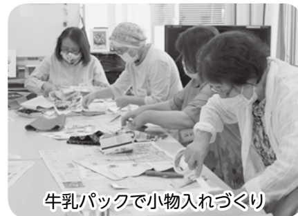
牛乳パックで小物入れづくり