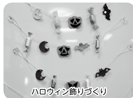
ハロウィン飾りづくり