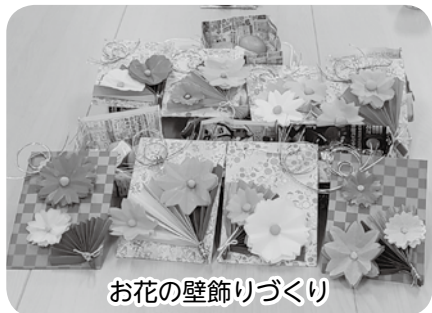
お花の壁飾りづくり

美祢・秋芳・美東の各ボランティアコーナーでは、だれでも参加できるミニ講座を毎月開催しています。今年度もコロナ禍のため感染対策をしながらの開催となりましたが、工夫を凝らして様々なミニ講座を開催しましたので活動の一部をご紹介します。