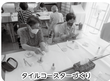
タイルコースターづくり