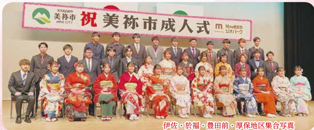
伊佐・於福・豊田前・厚保地区集合写真

←こちらのQRコード でお申し込みができ ます。お名前(ふり がな)・性別・生年月 ・一言・町名・電話番 号・記入の上、ご応 募願います。