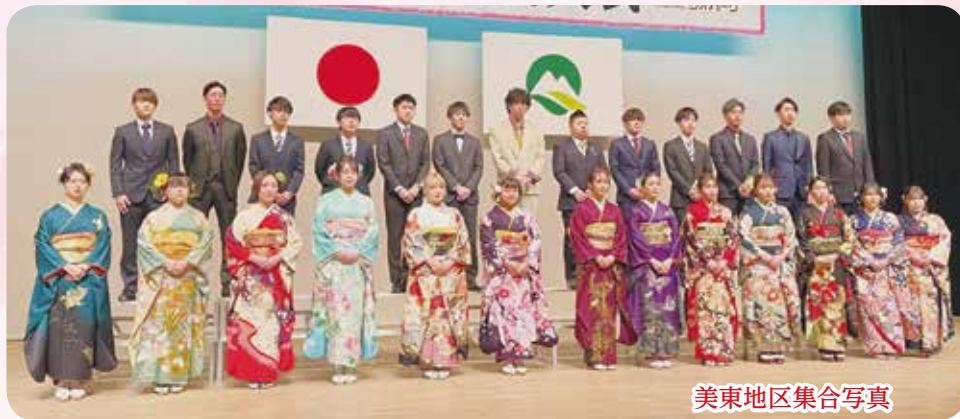
美東地区集合写真