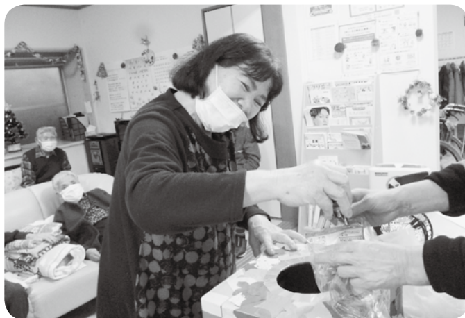
お菓子のつかみどりをしている様子

令和3年12月6日、7日に年忘れ会を開催しました。新型コロナウイルス感染拡大防止の観点により、2日間の開催でした。豪華な昼食と合唱、ジャンケン大会、ビンゴゲーム、お菓子のつかみどりなどで楽しい時間を過ごされました。