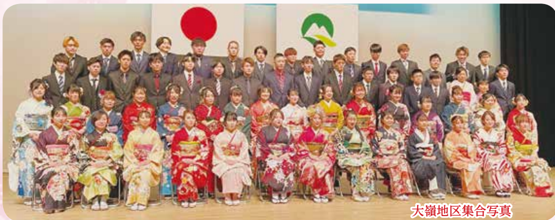
大嶺地区集合写真