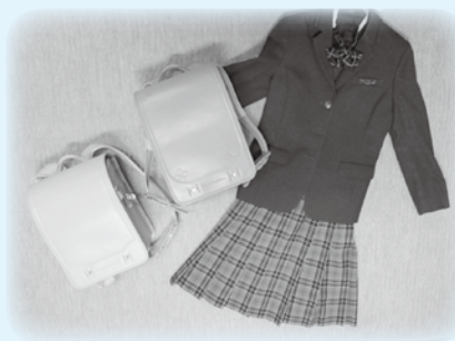
👉 ランドセル・学生服

このほかにも、さまざまな子育て用品があります。ご希望のものがない場合もありますので、詳しくはお問い合わせください。