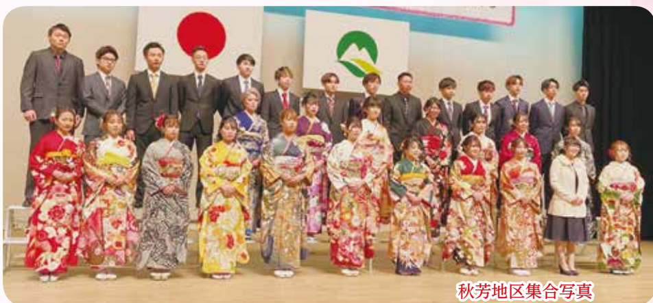
秋芳地区集合写真