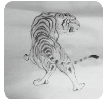
三戸さんが描かれた水墨画の虎。来年は寅年ですね！！

書道です。高校の時、書道を教えてくれた先生に「卒業しても書道を続けたいと思っているけど、どうしたらいいですか？」と尋ねると、「好きな字があったら、好きな字を書いてどんどん勉強しなさい。」と言われて、それからは気ままに書道を今でも続けています。書道を続けていく中で、特に すずり 硯に興味を持つようになって、一時期とても研究しておりました。いい字を書いたり、いい絵を描いたりするには、やっぱりいい硯が必要です。もちろん、筆や墨もそうですね。いい道具を使うことで、始めるときから、気持ちが変わってきますから。あと、書道以外にも、水墨画や漢詩、詩吟もやっています。今やっていることを全うすることがこれからの目標ですね。