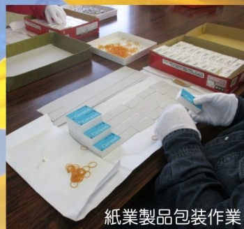
紙業製品包装作業