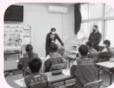
福祉教育活動支援