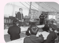
児童クラブ年末活動支援