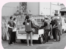
災害ボランティア活動支援