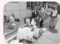
ボランティア活動支援