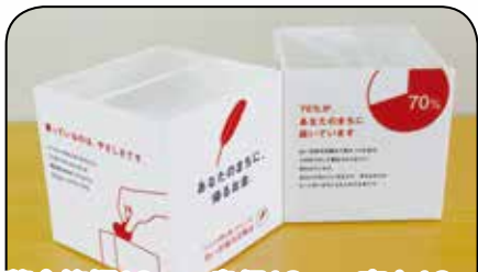
募金箱幅12cm 奥行12cm 高さ12cm

美祢市共同募金委員会では、募金箱の設置にご協力いただける事業所等を探しています。店頭や事業所受付、休憩場所などへの設置にご協力いただける場合は、本会までご連絡ください。