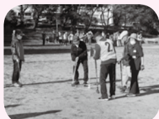
老人クラブ活動支援